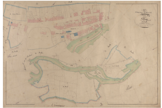
Cadastré de Charny-sur-Meuse en 1842 © Archives départementales de la Meuse, 139FI_0049_B_06

Nombre d'habitants en 1911: 449. En 1921: 240.