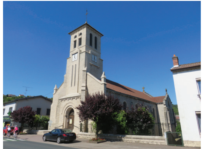
Vue extérieure