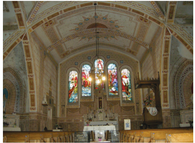
Vue intérieure