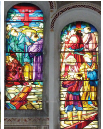
Vitraux de Jacques Gruber