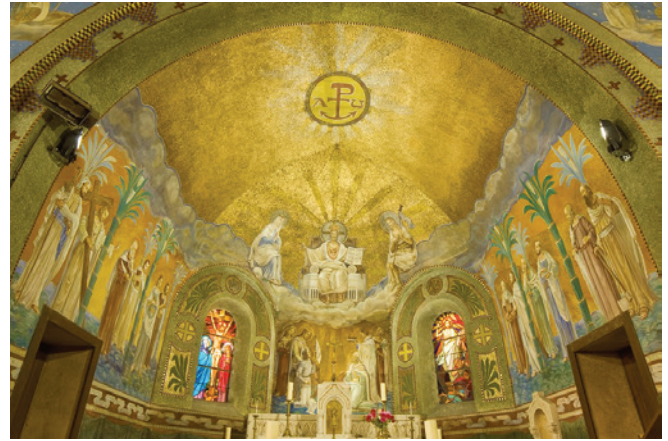
Vue intérieure

Le projet est approuvé en 1930 et le chantier est achevé en 1933. Avec son clocher-porche ouvert sur les côtés et se détachant de la façade, elle dérive des modèles néo-romans. Les vitraux de Georges Janin, datés de 1935, comprennent notamment un vitrail commémoratif figurant Saint-Marcel bénissant un soldat mort. Les peintures murales ont été restaurées en 2011. Le jeu savant des couleurs distingue les peintures murales de l'avant-chœur de celles du chœur. Duilio Donzelli a réalisé un ensemble d'une remarquable qualité artistique. Les personnages du chœur sont inspirés par la peinture italienne allant de la tradition ravennate à Raphaël en passant par Giotto, avec Jeanne d'Arc en armes aux pieds du pape, entourée du roi Saint-Louis et de Saint-Joseph. Au-dessus, la voûte entièrement recouverte d'une mosaïque aux tons bruns, est percée d'une scène lumineuse représentant un Christ majestueux assis sur un trône et tenant un livre ouvert sur lequel on peut lire «Ego sum via veritas et vita». E.J, P.L., D.L., P.P.