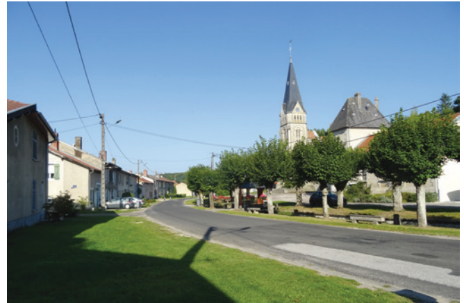
Espace public de Seuzey structuré par le ruisseau canalisé