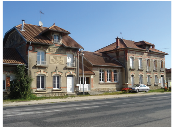
Bâtiments abritant la mairie-école et la poste

Nombre d'habitants en 1911: 311. En 1921: 134.