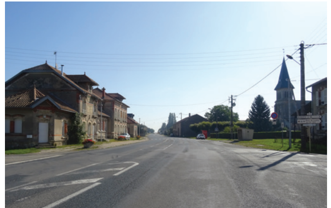
Place regroupant la mairie et l'église au centre de Manheulles