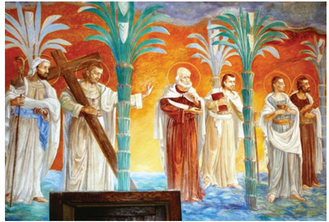
Fresque (c) Dominique Lacorde