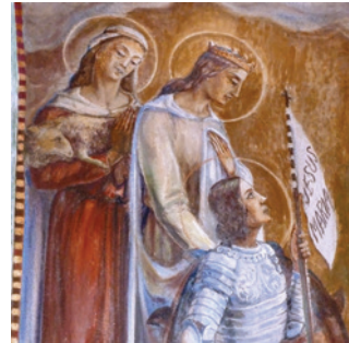
Détails (c) Dominique Lacorde