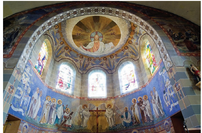
Vue intérieure