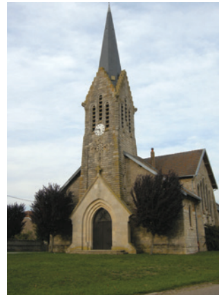
Vue extérieure