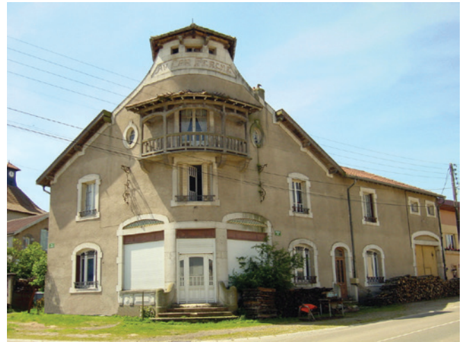
« Au Coq Perché »

Nombre d'habitants en 1911: 349. En 1921: 312.