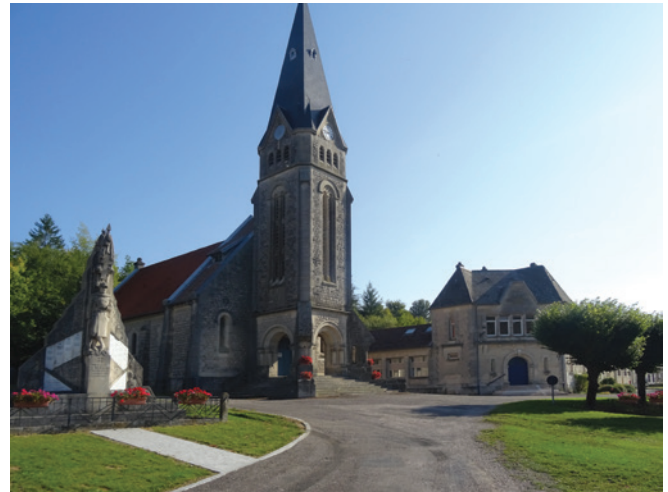
Place regroupant l'église, le Monument aux Morts et la mairie à Seuzey

Nombre d'habitants en 1911: 296. En 1921: 59.