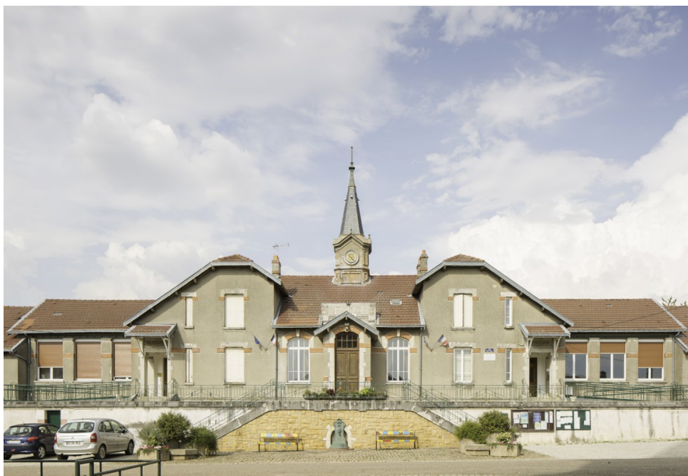
Mairie d'Eply (54), 2015