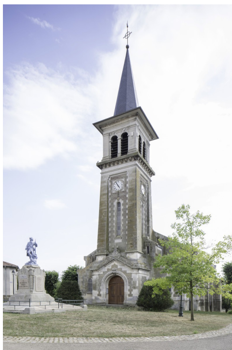
Eglise d'Eply (54), 2015