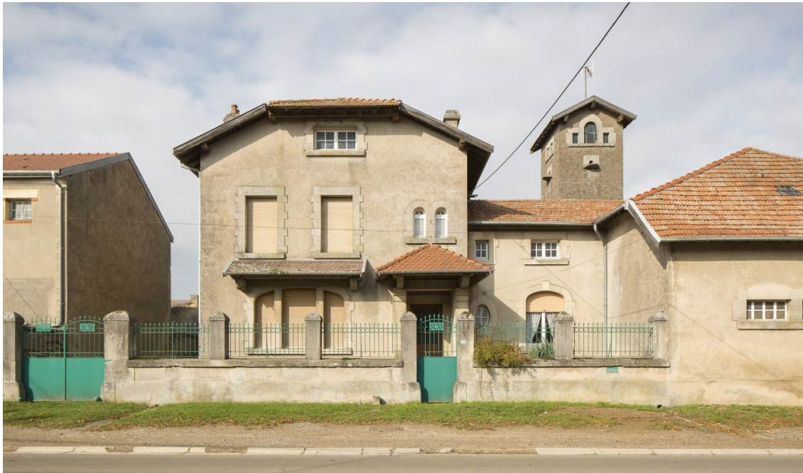
Habitation, Eton (55), 2015